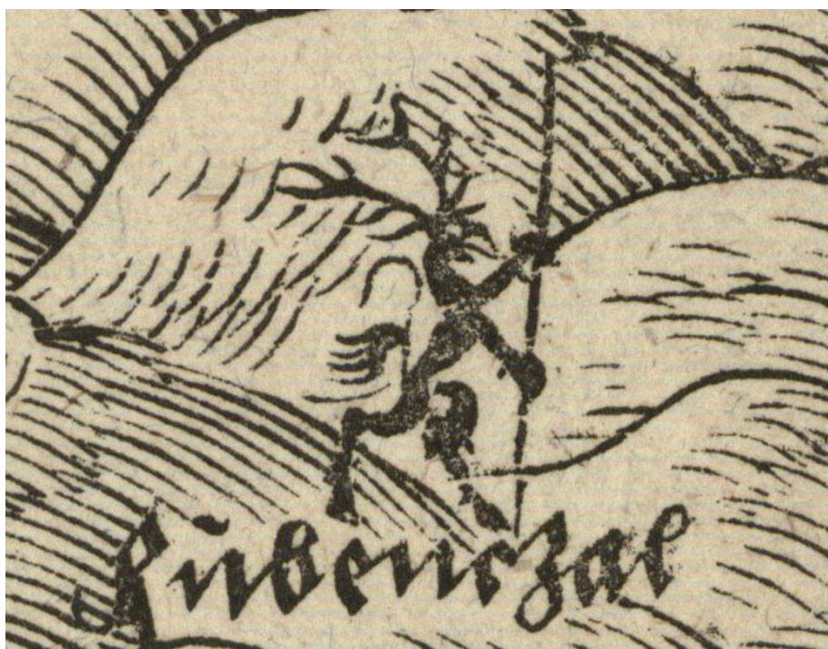
První známé vyobrazení Rübészala. Helwigova mapa Slezska z roku 1561

Ke Krkonošům se neodmyslitelně váže postava bájného ducha hor, jenž v různých podobách chrání celé pohoří před pytláky či chamtivými hledači pokladů – Krakonoše. Tohle jméno mu ve své baladě Krkonošská kleč z roku 1824 prvně připsal Václav Kliment Klicpera, avšak v horalské tradici se objevuje již od 15. století a jeho první vyobrazení, pod německým jménem Rübészal (zčeštěle Rýbrcou), nacházíme na Helwigově mapě Slezska z roku 1561.