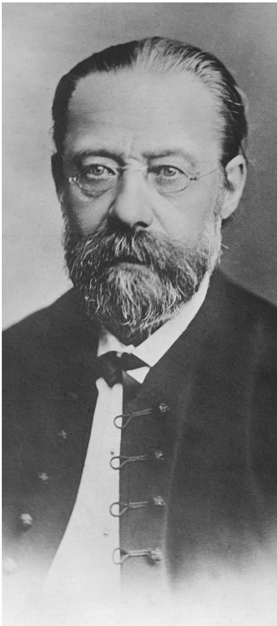
Bedřich Smetana před rokem 1880