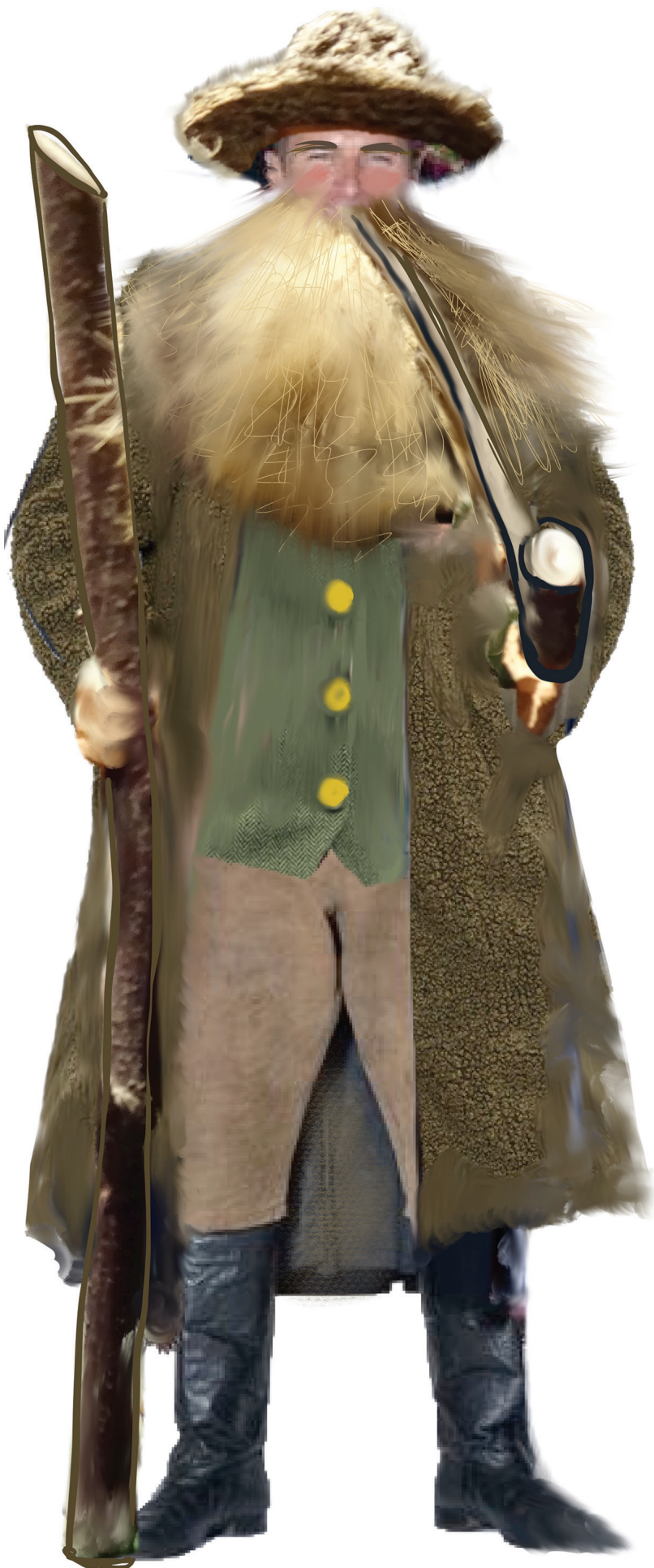
Kostýmní návrh Simony Rybákové pro postavu Matouše