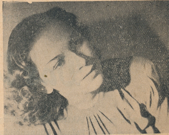
LÍDA VOSTRČILOVÁ — ARCHIV ČDMO

Komedie o 3 dějstvích. Přeložil Lad. Kulhánek. Režisér Karel Palouš. Výtvarník Jan Sládek.