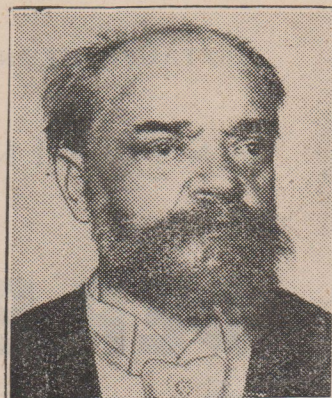
ANTONÍN DVOŘÁK

Komická opera o dvou dějstvích. Text napsal J. O. Veselý.