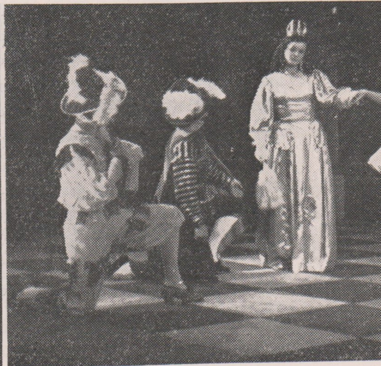
Královna, prince Z. Brázdová, H. Kr