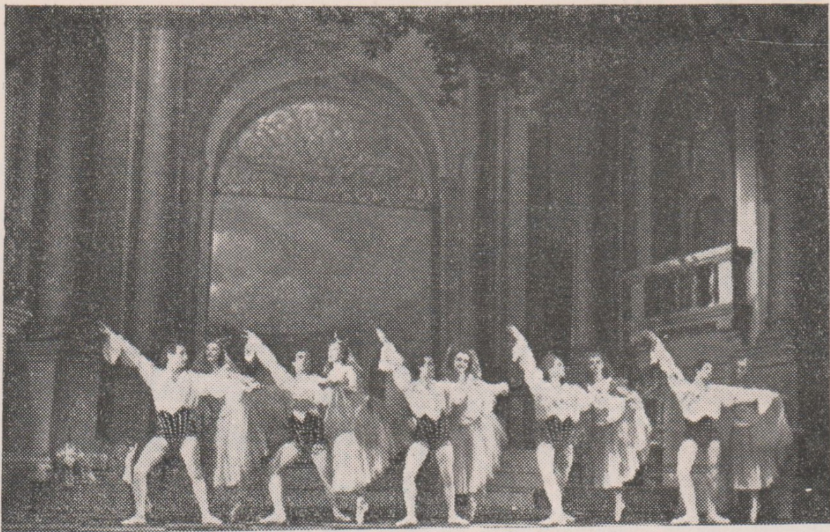
Záběr z I. obrazu na scéně prof. J. Obšila