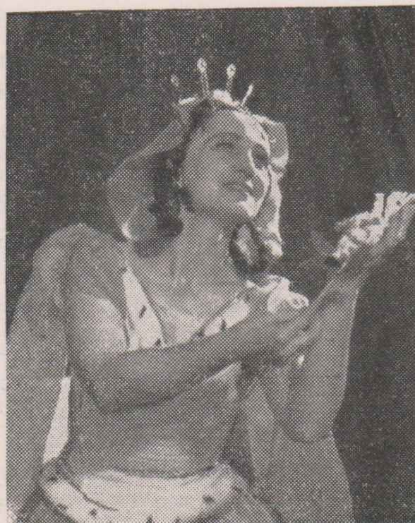
Dobrá víla — J. Jastřembská