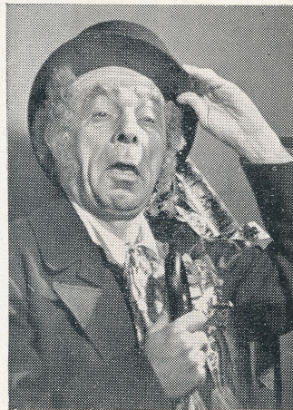
Kecal - J. Herold