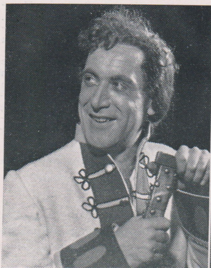
Rudoš — K. Lupínek.