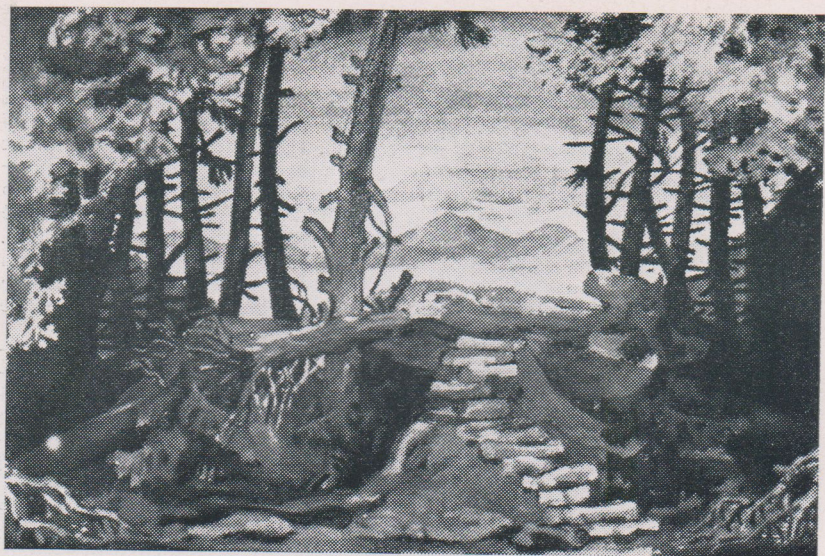
Návrh scény Zd. Hyblera.