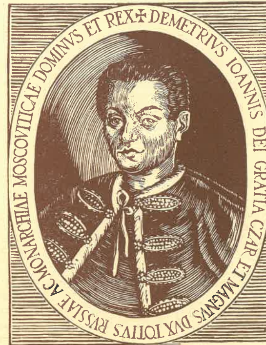
Soudobý portrét cara Demetria Samozvance I (dřevoryt)

Děj libreta M. Červinkové — Riegrové se opírá o bouřlivé události ruských dějin, po smrti cara Borise Godunova, v historii zvaných „smutnoje vremja“.