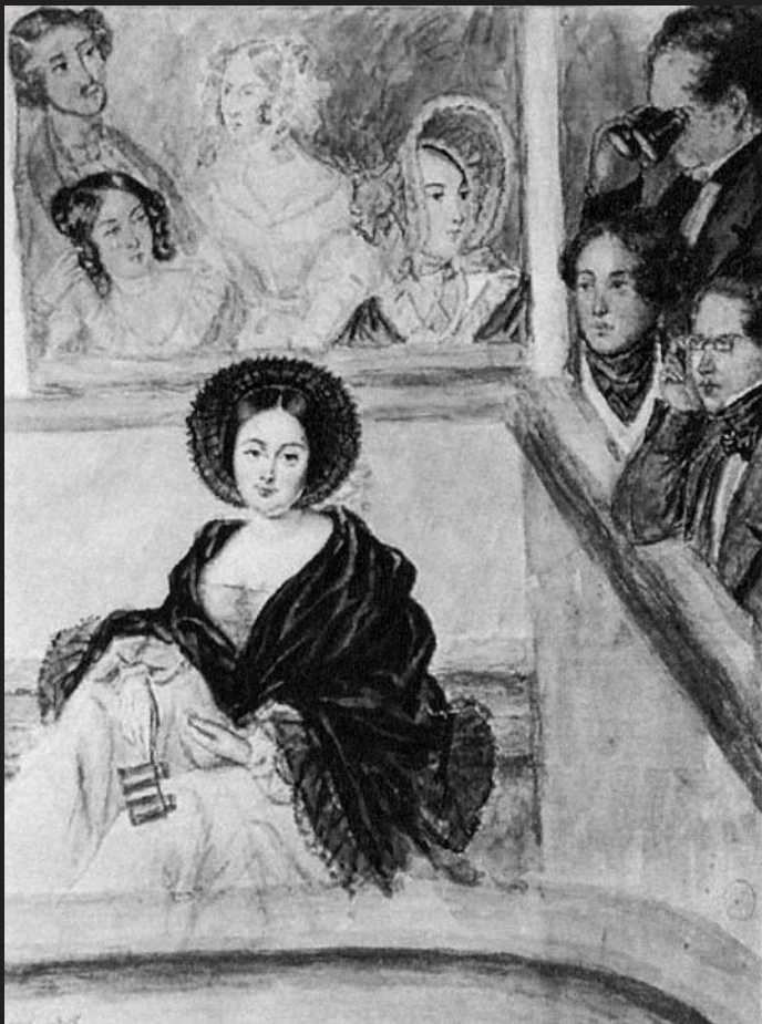
Camille Roqueplan – portrét Marie Duplessis v divadle

„Markéta se účastnila všech premiér a své večery trávil buď v divadle, nebo na plesích. Kdykoli se objevila nová hra, mohli jste si být jisti, že Markétu spatříte v divadle se třemi předměty, bez kterých se nikdy neobjevila a které vždy ležely na pažení její přízemní lóže: kukátko, sáček s bonbóny a kytice kamélií.“