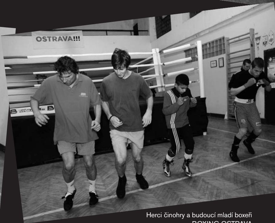
Herci činohry a budoucí mladí boxeři BOXING OSTRAVA