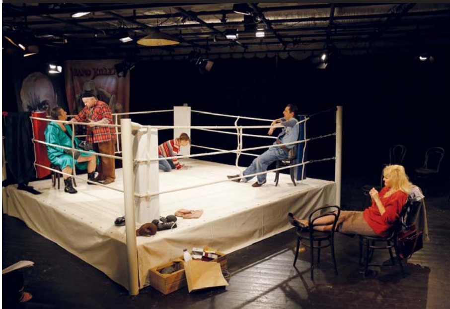
Celkový pohled na scénu