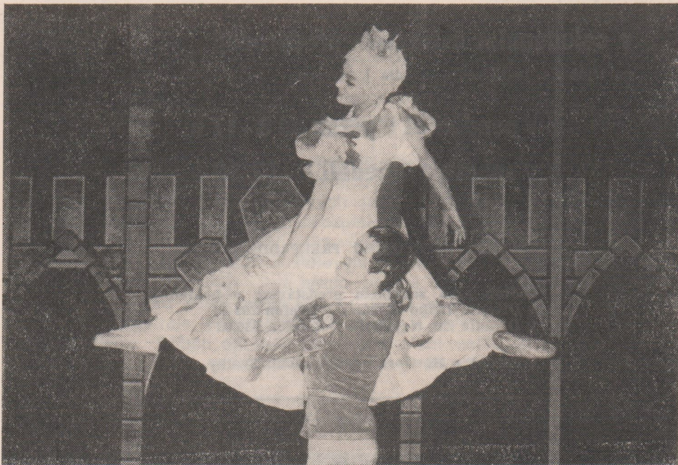
O. Nedbal: Z POHÁDKY DO POHÁDKY