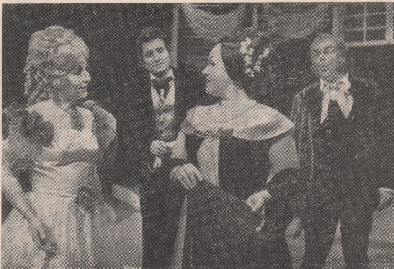
B. Smetana: DVĚ VDOVY