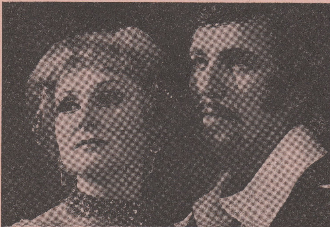
E. Eysler: ZLATÁ PANÍ MISTROVÁ