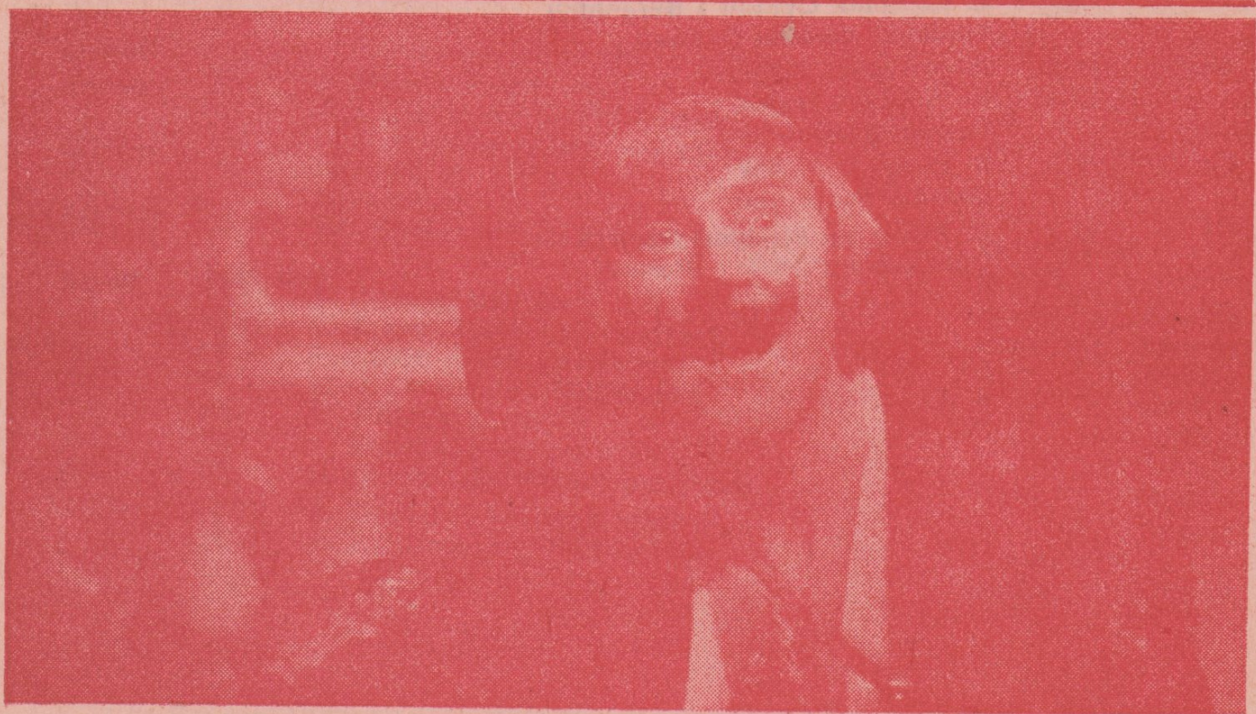
E. Rostand: CYRANO Z BERGERACU

Československou premiéru opery připravujeme na sobotu 10. prosince 1977.