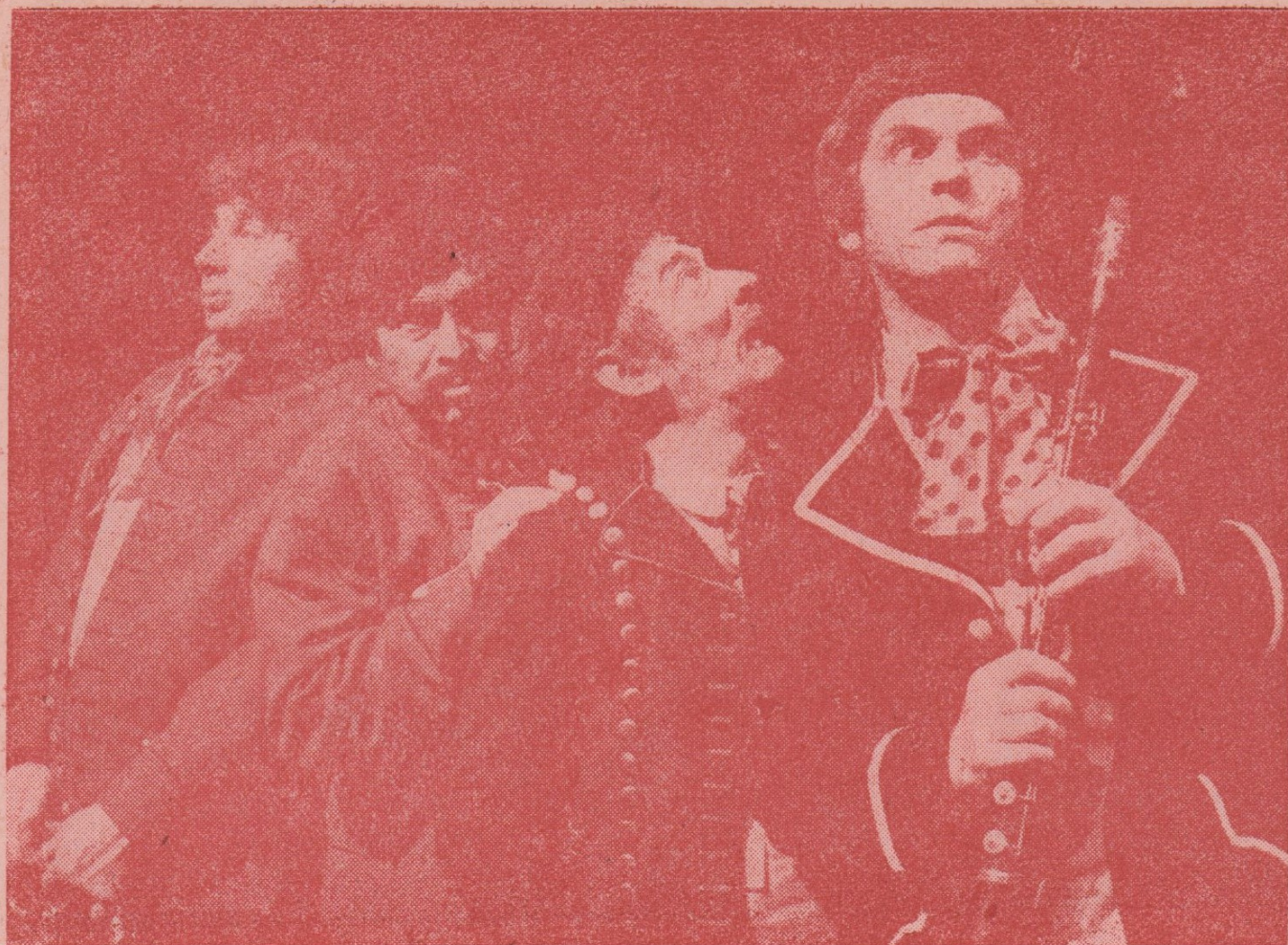
A. Jirásek: LUCERNA