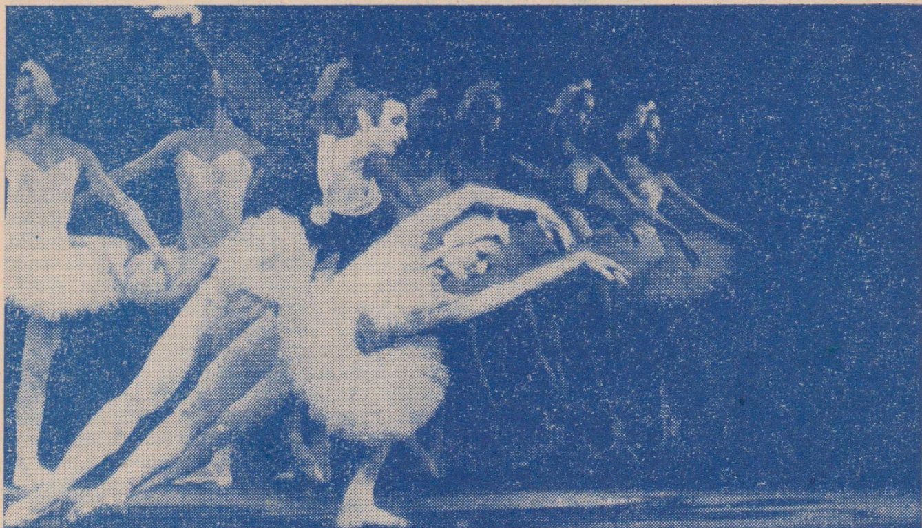
P. I. Čajkovskij: LABUTÍ JEZERO

Upozorňujeme naše stálé návštěvníky – předplatitele, že lhůta pro obnovení předplatného na rok 1979–1980 končí 10. listopadu t. r.