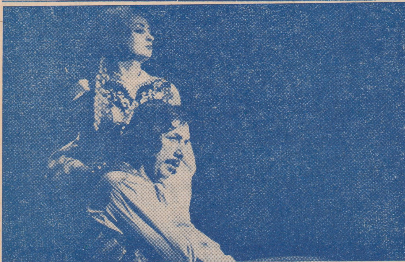
A. Petrov: PETR I.