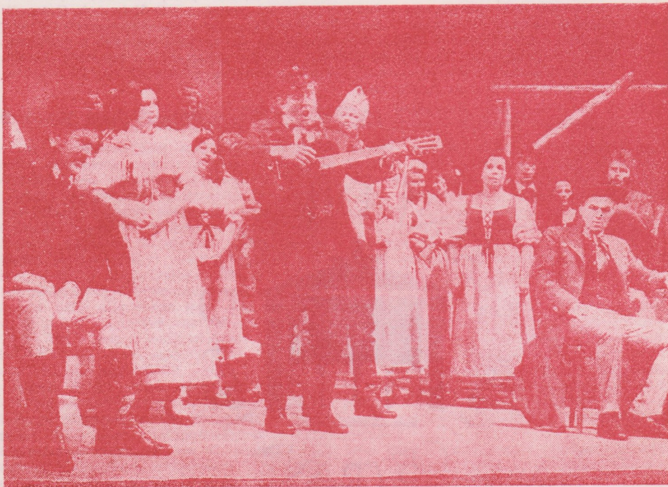
B. Smetana: TAJEMSTVÍ