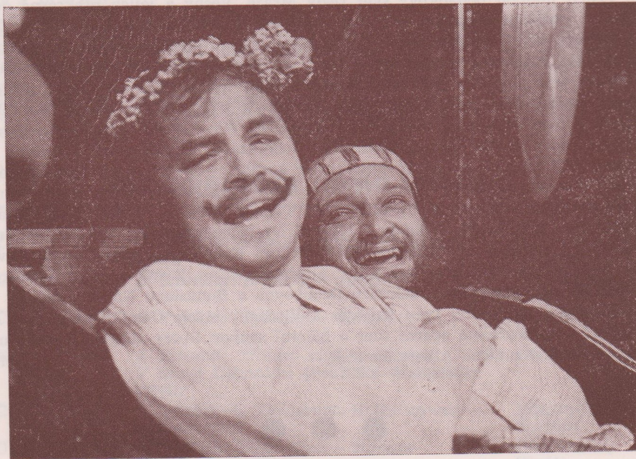
J. B. Molière: ZTŘEŠTĚNEC