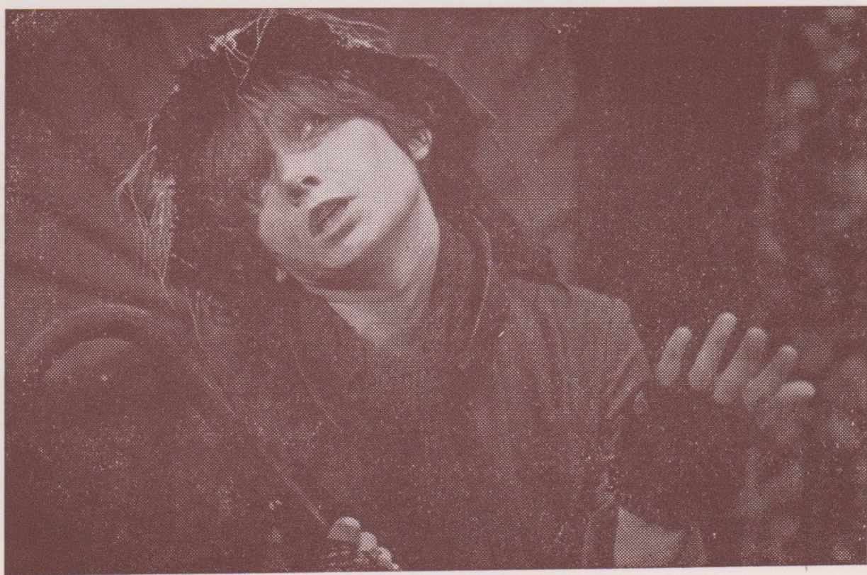
G. B. Shaw: PYGMALION