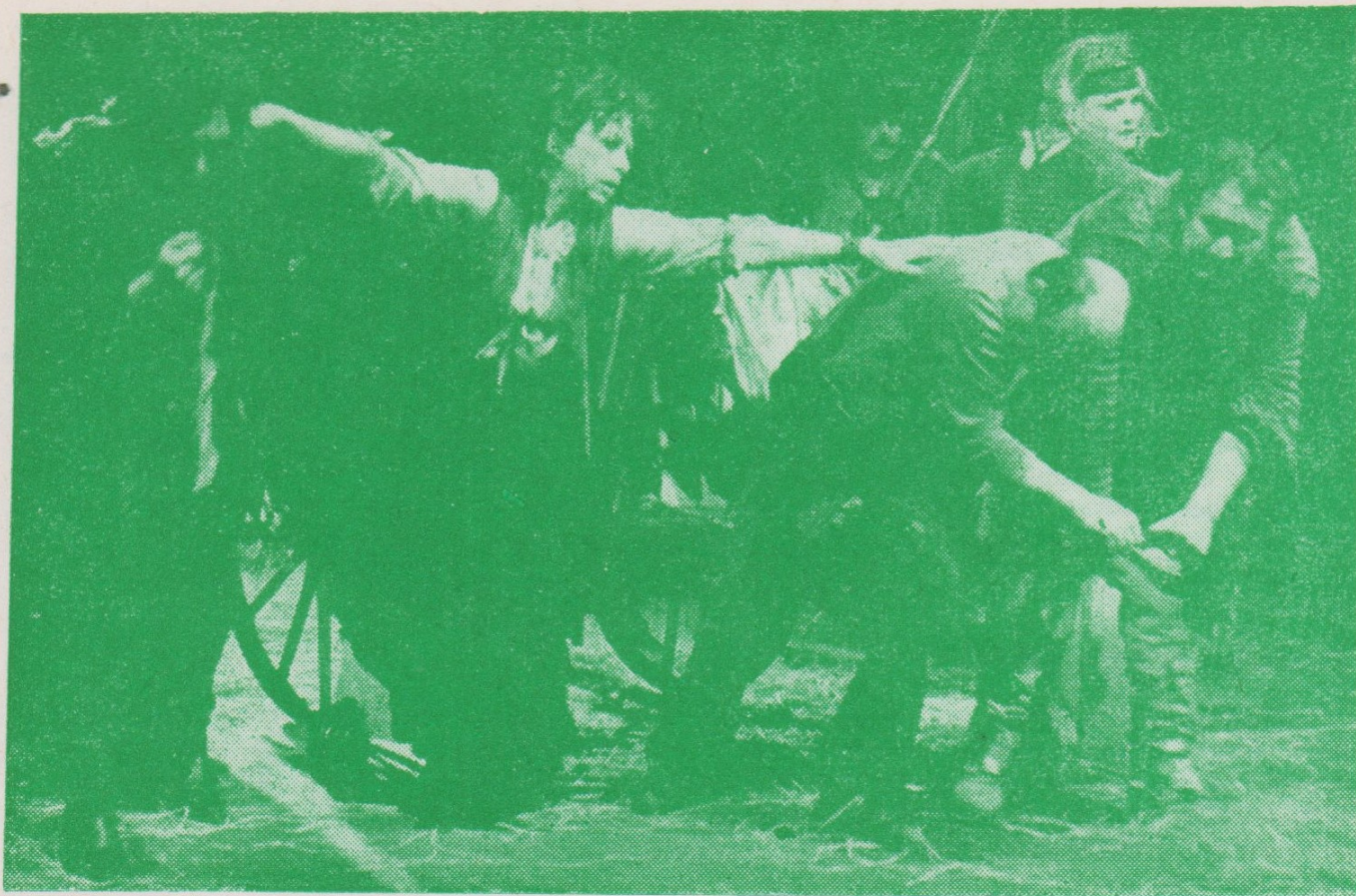
O. Daněk: VÉVODKYNĚ VALDŠTEJNSKÝCH VOJSK (činohra DZN)