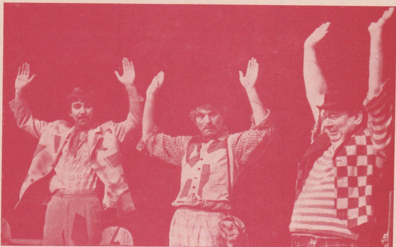
J. N. Nestroy: LUMPACIVAGABUNDUS — operetní soubor (hudební komedie v provedení operetního souboru zařazená do nového předplatného scény Petra Bezruče)