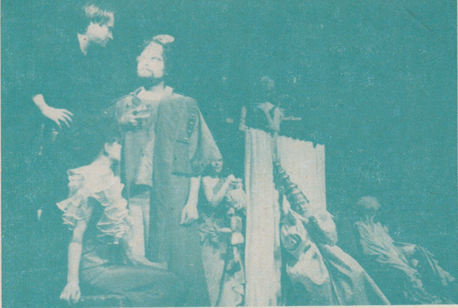
W. Shakespeare: Tragický příběh Hamleta, dánského prince — činohra Petra Bezruče