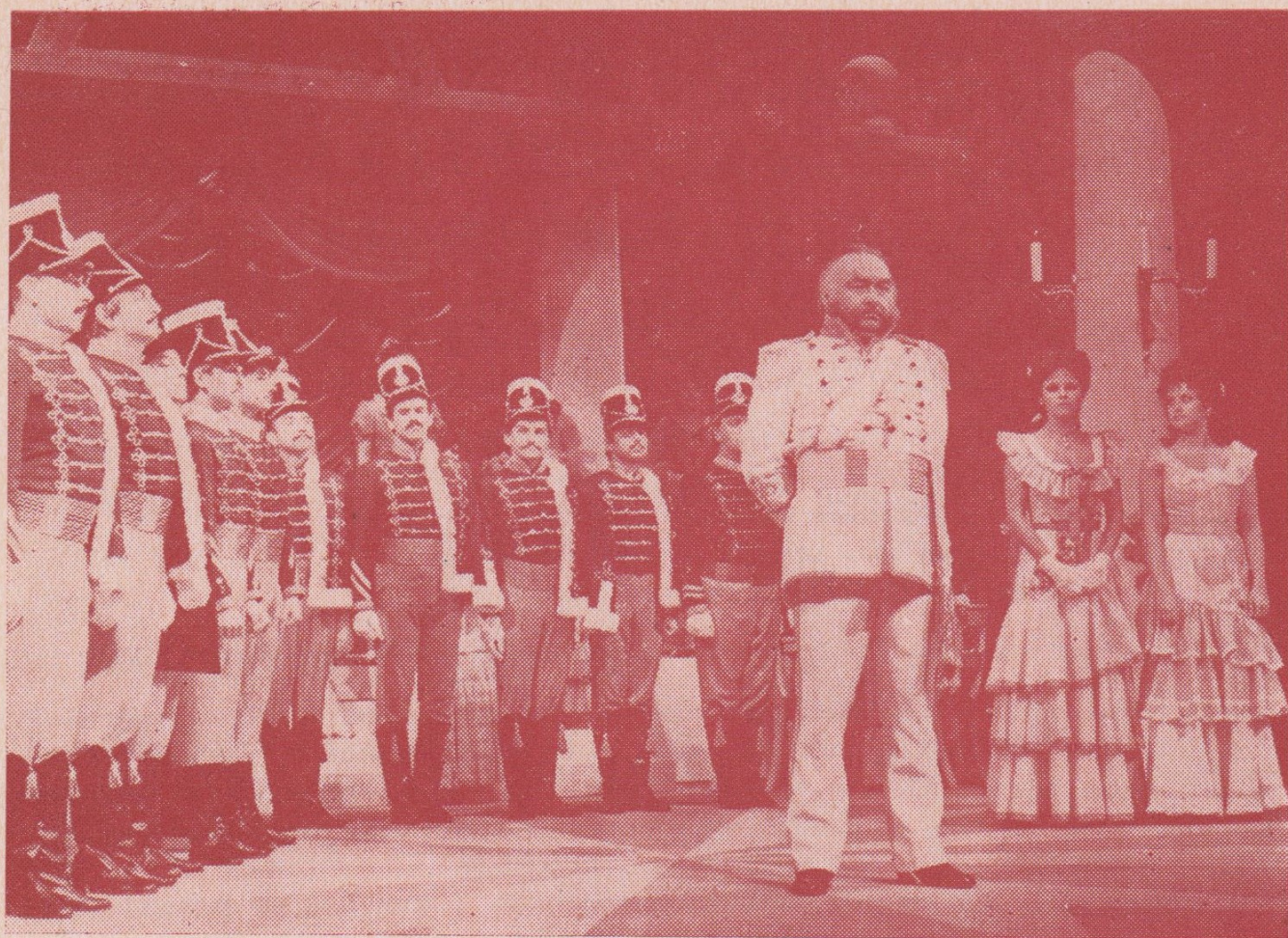
E. Kálmán: PODZIMNÍ MANÉVRY — opereta v Divadle Zd. Nejedlého