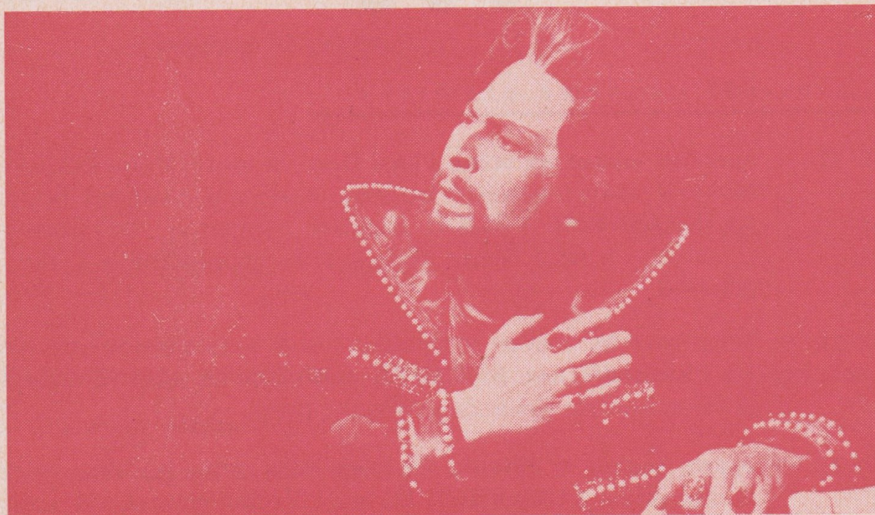
M. P. Musorgskij: BORIS GODUNOV