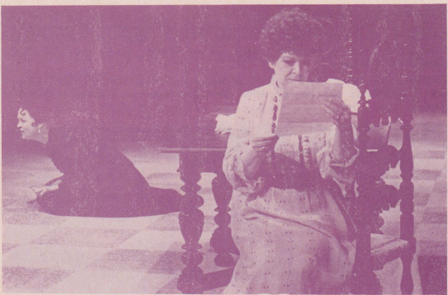
A. Casona: Dům se sedmi balkóny — uvádí činohra v Divadle Zdeňka Nejedlého