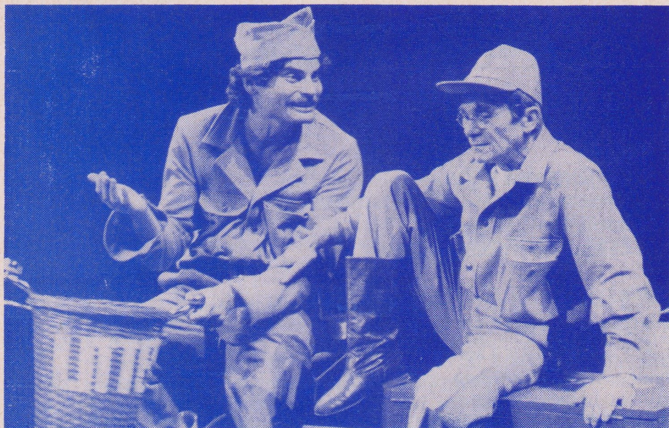
J. Heller: HLAVA XXII — činohra P. Bezruč