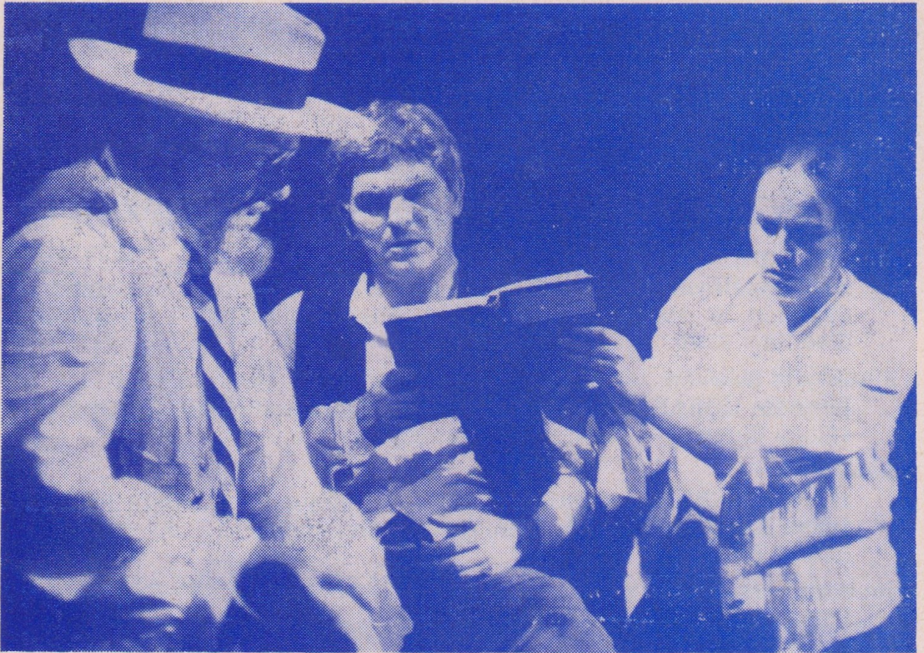
V. Vančura — J. Kačer: PEKAŘ JAN MARHOUL — činohra v DZN