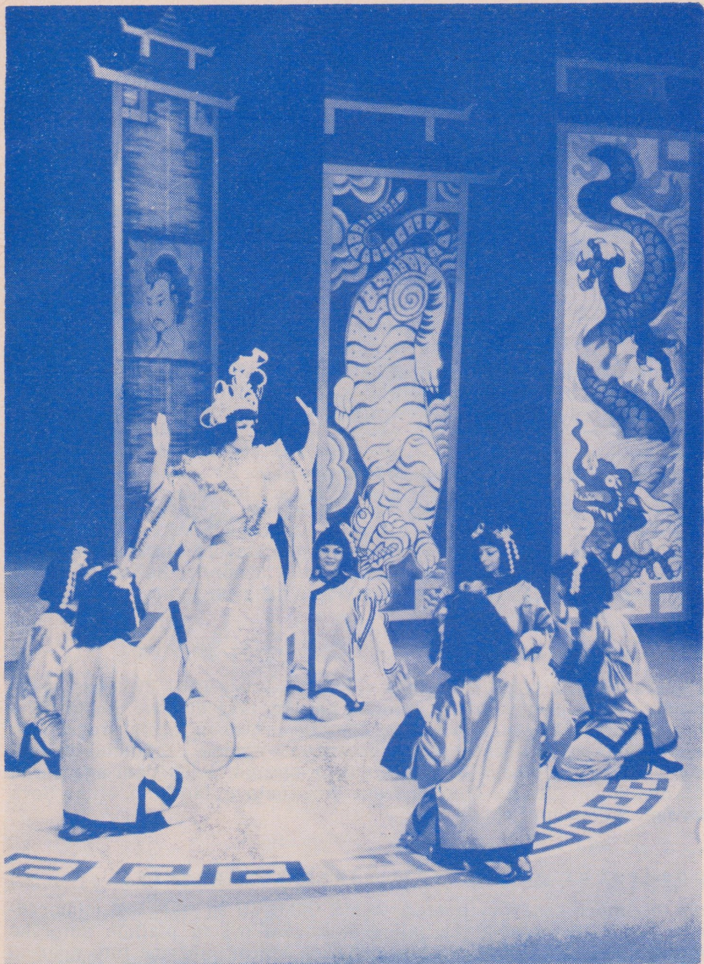
F. Lehár: ZEMĚ ÚSMĚVŮ — opereta v Divadle Jiřího Myrona (D. Hlubková)