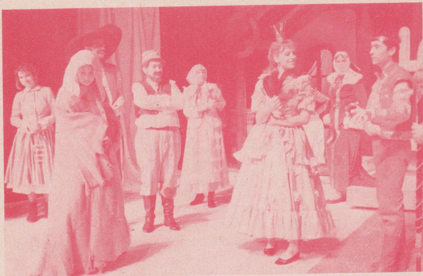
J. Jílek: POPELKA A PRINC — činohra Petra Bezruče