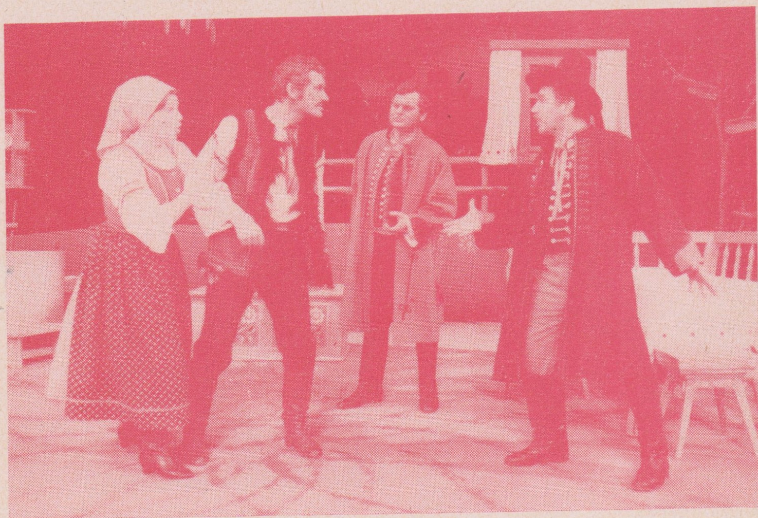
R. Kubín: PASEKÁŘI — opereta v Divadle Jiřího Myrona