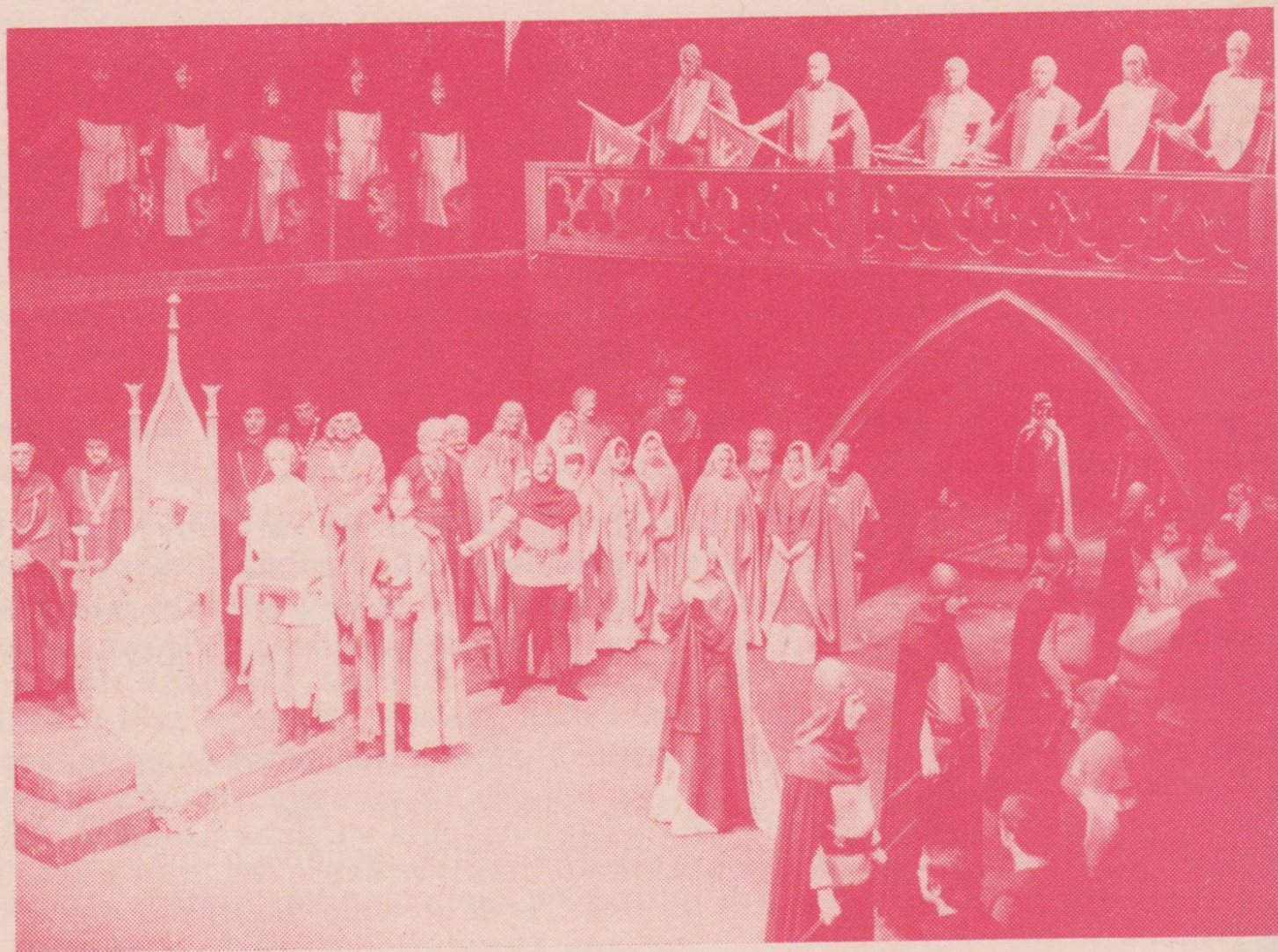
B. Smetana: DALIBOR — opera v Divadle Zdeňka Nejedlého 25. února 1989. Slavnostní představení na počest Vítězného února.

PREMIÉRA SE KONÁ DNE 4. ÚNORA 1989 NA SCÉNĚ DIVADLA PETRA BEZRUČE.