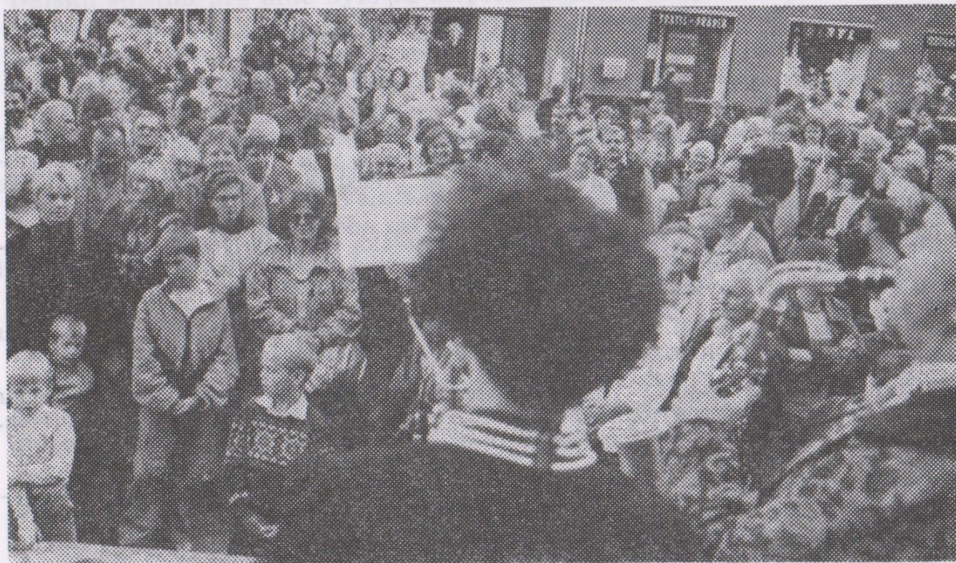
Reportážní snímky jsou z DIVADELNÍHO HAPPENINGU ze 7. září, kdy herci SDO vyšli v kostýmech z Divadla Jiřího Myrona, aby v průvodu ulicemi města i na Jiráskově náměstí pozvali návštěvníky na představení a zahájili novou divadelní sezónu 1992/93. Akce se zúčastnili i studenti konzervatoře. V řadách diváků bylo tentokrát více mládeže ostravských středních škol.