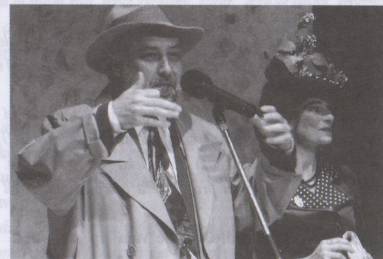
Herkules a Augiášův chlév