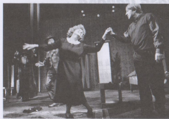
Vrátila se jednou v noci