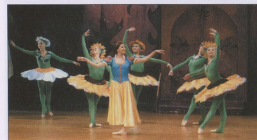
SNĚHURKA A SEDM TRPASLÍKŮ