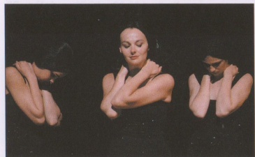
HEDA GABLEROVÁ

30. úterý 19.00 – 21.30 hodin Sk. E Joe Masteroff – Fred Ebb – John Kander / CABARET / Slavný broadwayský muzikál ověnčený mnoha cenami.