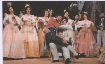
GASPARONE, ZÁHADNÝ LOUPEŽNÍK