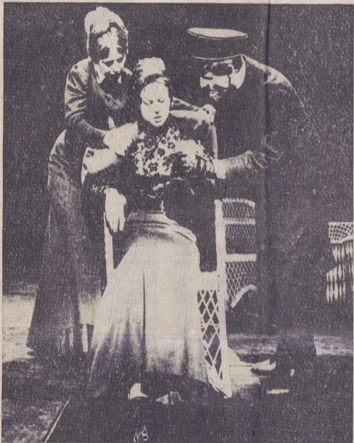
Tří sestry A. P. Čechova v Divadle za branou. I. cena

zároveň i o našich touhách, lůzích a zklamáních, čímž skládilo toto představení nevdědní úspěch jak u nás v Československu, tak i za hranicemi.