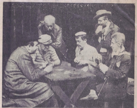
Z inscenace hry M. Gorkého Na dne v Divadle Slovenského národního povstání. Cena Svazu čs.-sovětského přátelství