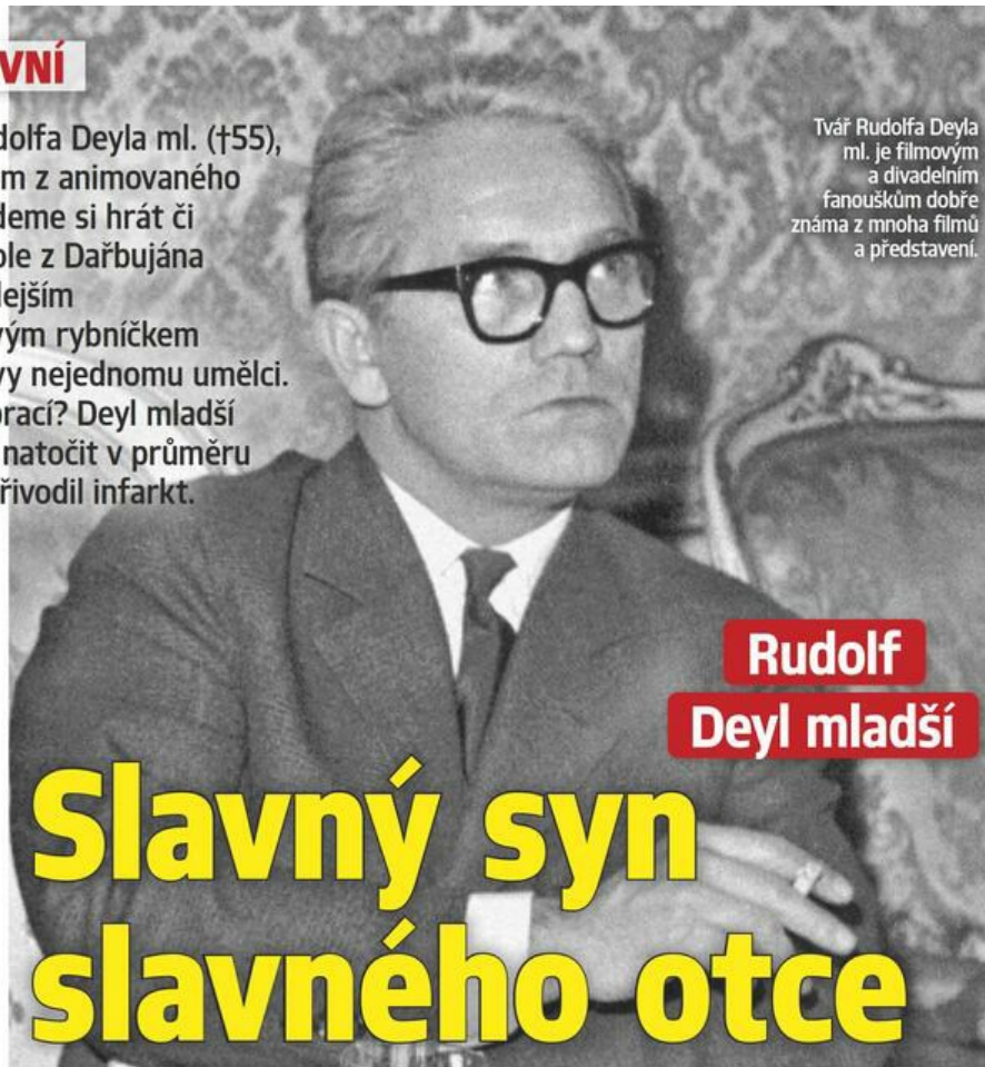
Tvář Rudolfa Deyla ml. je filmovým a divadelním fanouškům dobře známa z mnoha filmů a představení.