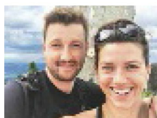
Velký moment Snímek herečky a jejího