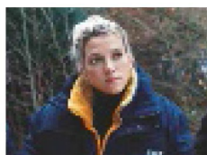
Z natáčení Kvůli roli agentky Em si

NA SVOJI PRVNÍ ROLI V CELOVEČERNÍM FILMU VZPOMÍNÁ MOC RÁDA, KROMĚ FYZICKÉ PŘÍPRAVY KVŮLI NÍ PROŠLA I LEHKOU ZMĚNOU VIZÁŽE. I KDYŽ MÁ HODNĚ PRÁCE, NA RODINU SI ČAS NAJDE VŽDYCKY.