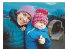
Role maminky S absolutou dekou Madou