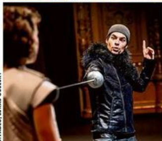
DIVADLO, LUKÁŠ OULSKÝ