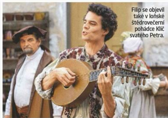
Filip se objevil také v loňské štědrovečerní pohádce Klíč svatého Petra.

Na to asi nemám odpověď. Jsem otevřený všemu a nemám žádnou vysněnou roli. Jak se například říká, že všichni by chtěli hrát Hamleta, tak já bych třeba Hamleta hrát