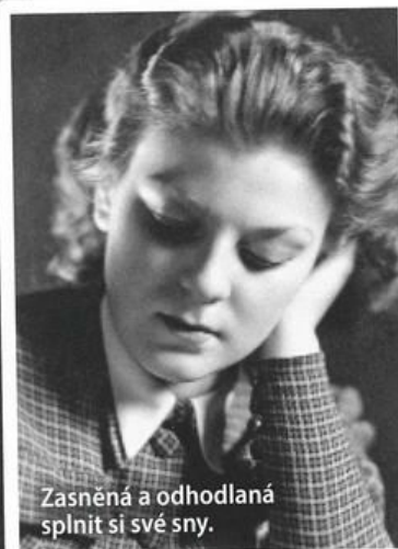
Zasněná a odhodlaná splnit si své sny.

První opravdový úspěch zažila ve hře Ze života hmyzu v roce 1947 v Ostravě.