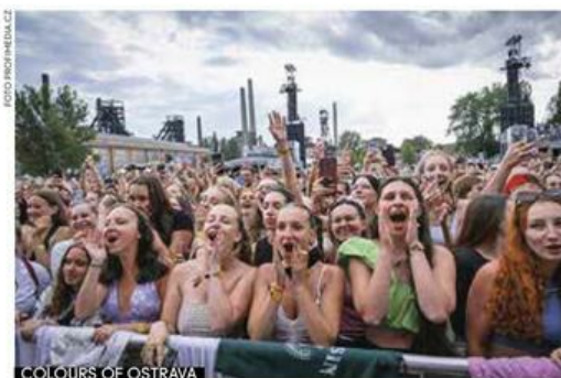
COLOURS OF OSTRAVA