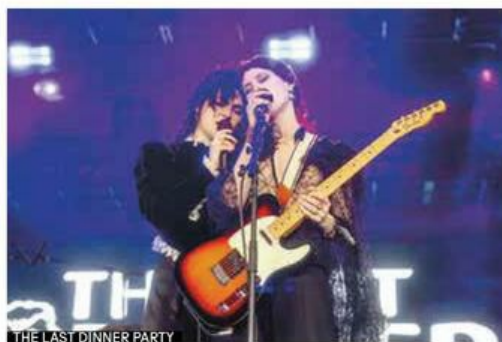
THE LAST DINNER PARTY