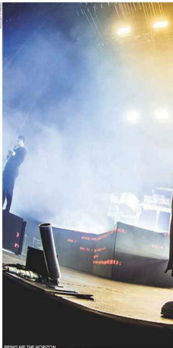
BRING ME THE HORIZON

V jedinečném areálu bývalého vojenského letiště s osmi hangáry, jež podtrhují atmosféru a slouží jako zázemí pro některé scény, se koná hudební festival, který pravidelně otevírá celou letní sezonu. Hlavními hvězdami 29. ročníku Rock for People jsou aktuální držitelé Brit Awards Bring Me The Horizon, punkrockoví veteráni The Offspring, kteří letos slaví 40 let na scéně, jedna z nejproslulejších elektronických kapel všech dob The Prodigy a miláček generace Z Yungblud. Headlinery doplňuje Avril Lavigne, frontman kapely Slipknot Corey Taylor v sólovém projektu nebo kapela Dogstar, kterou po dvacetileté pauze vzkřísil její zpěvák a baskytarista – a jinak také hollywoodská hvězda Keanu Reeves.