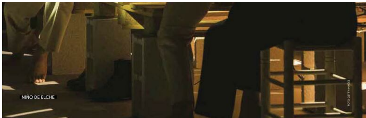
NIÑO DE ELCHE