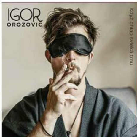
Když chlap svléká tmou