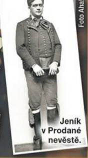
Jeník v Prodané nevěstě.