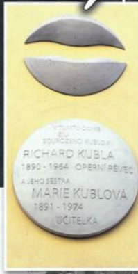
Kublu pohřbili v Praze na vyšehradském Slavíně.