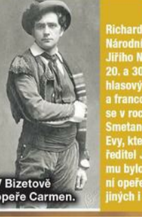
V Bizetově opeře Carmen.