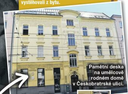
Pamětní deska na umělcově rodném domě v Českobratrské ulici.