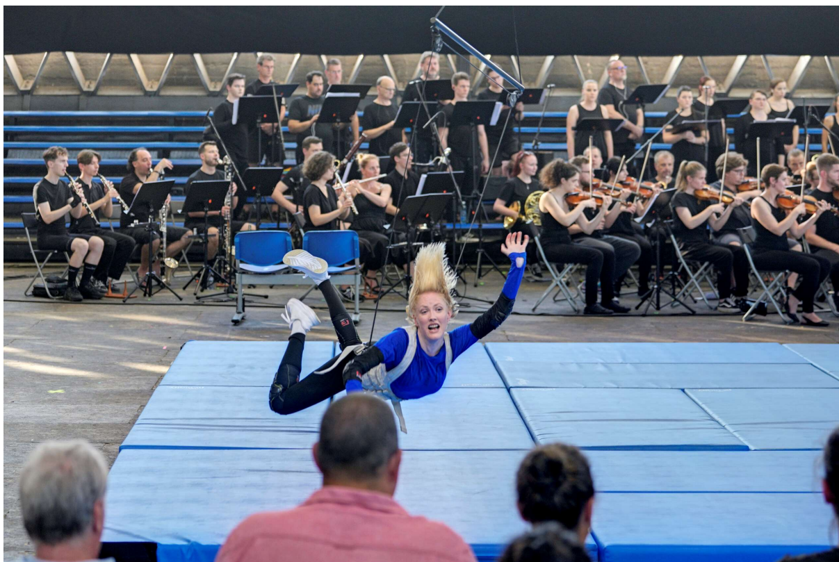
Z představení Impact.