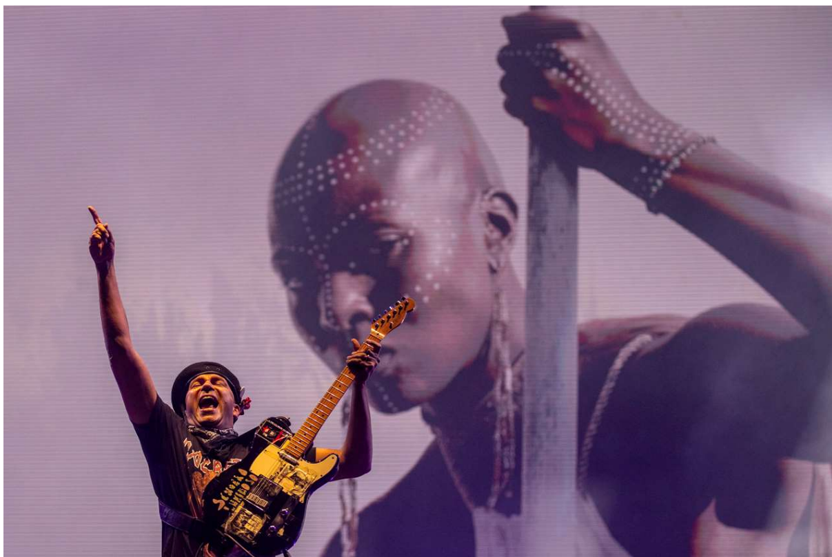
Colours of Ostrava, Dolní Vítkovice, 17. července 2024, Ostrava. Tom Morello.

Nejlepší snímky kolektiv autorů vybral z širšího portfolia. Nejprve každý připravil deset svých fotografií, z nichž nakonec vznikl finální výběr. „Nachystali jsme fotografie, kterých si nejvíce ceníme nebo se nám zdá, že je to to nejlepší z naší tvorby. Společně jsme se pak nad nimi sešli a vybrali z nich výslednou kolekci pro výstavu. Chtěli jsme, aby tam bylo zastoupeno široké spektrum událostí. Důležité pro nás bylo, ať je to pestré i pro samotné diváky. Nechtěli jsme, ať se třeba dívají na šest fotografií z divadelního prostředí,“ vysvětlil Kaboň.