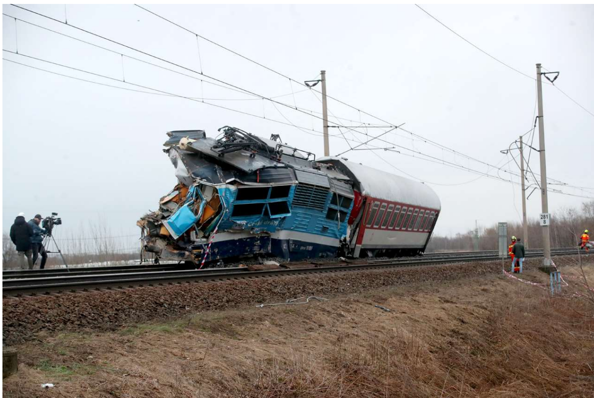
Torzo lokomotivy po železničním neštěstí v Dolní Lutyni na Karvinsku. Dolní Lutyně, 25.1.2024.