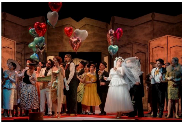
Nino Rota: Florentský slaměný klobouk, Divadlo Antonína Dvořáka, Ostrava