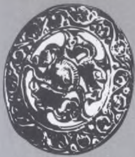
slovanské bronzové kování

Veškerá práva k provozování hudby zastupuje DILIA Praha Inscenace vznikla za finanční podpory Ministerstva kultury ČR