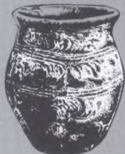
soudkovitá slovanská keramika