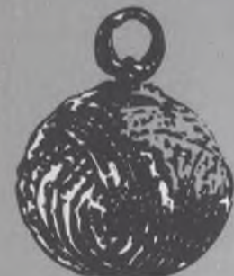
knoflík Slovanů - gombík