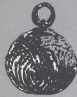
knoflík Slovanů - gombík