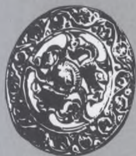
slovanské bronzové kování