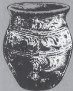
soudkovitá slovanská keramika