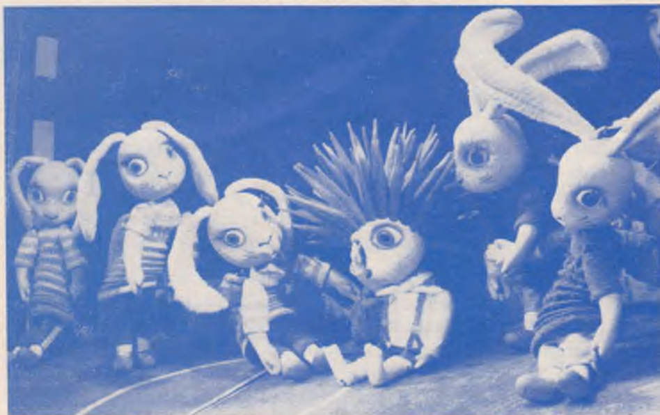
K. Krastev: JEZEČEK ŽOŽO — loutkoherecký soubor v Divadle loutek