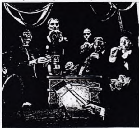
Z představení Kytice