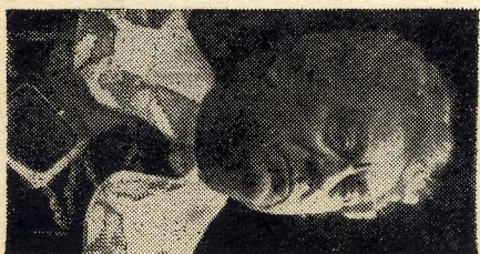
Rochefort, Hrabě de Winter