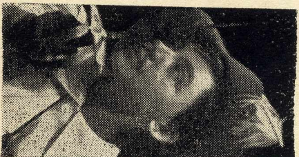
Ludvík XIV., Vicomte de Bragelogne