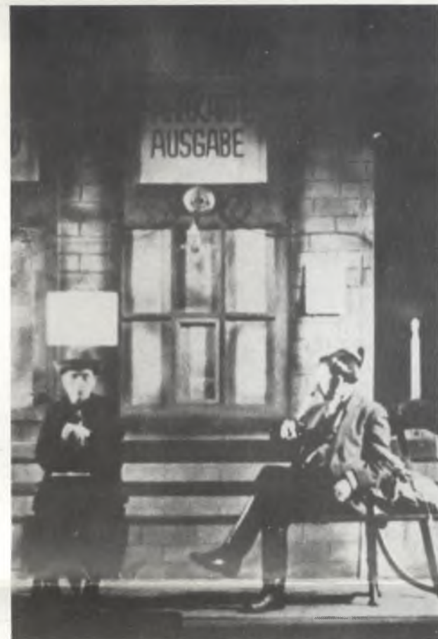
SODNÝ DEN, NĚMECKÉ DIVADLO V MORAVSKÉ OSTRAVĚ, 11. 12. 1937

VÍRA, NADĚJE A LÁSKA BY SE MOHLA JMENOVAT KAŽDÁ MOJE HRA.