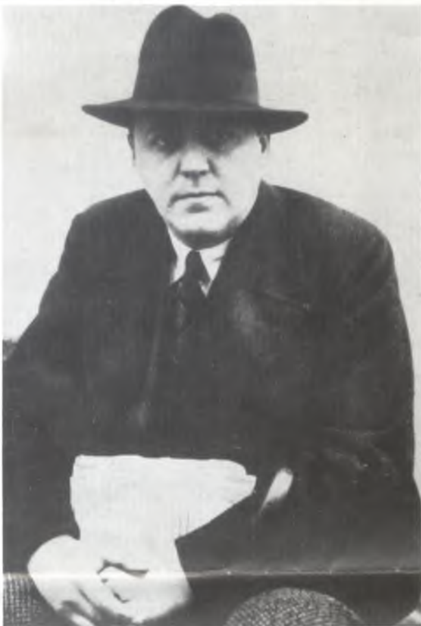
ODON VON HORVÁTH V ROCE 1938

DIVADLO JAKO UMĚLECKÝ ÚTVAR NEMŮŽE ZANIKNOUT JEDNODUŠE PROTO, ŽE JE LIDÉ POTŘEBUJÍ. PRO MNE JE TO SAMOZŘEJMÝ FAKT. DIVADLO DÁVÁ DIVÁKŮM NAHLÉDNOUT DO SVĚTA FANTAZIE, KTERÝ PRO NĚ VYTVÁŘÍ A DÁVÁ JIM MOŽNOST TENTO SVĚT DOTVÁŘET A SPOLUPROŽÍVAT FANTASTICKÉ DĚJE.