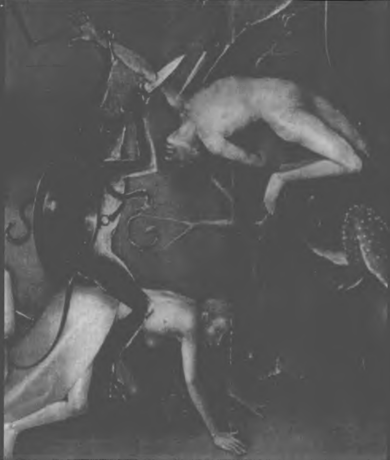
HIERONYMUS BOSCH: POSLEDNÍ SOUD