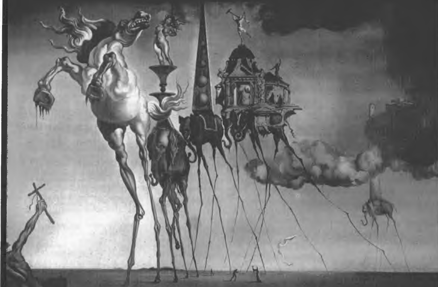
SALVADOR DALÍ: POKUŠENÍ SV. ANTONÍNA