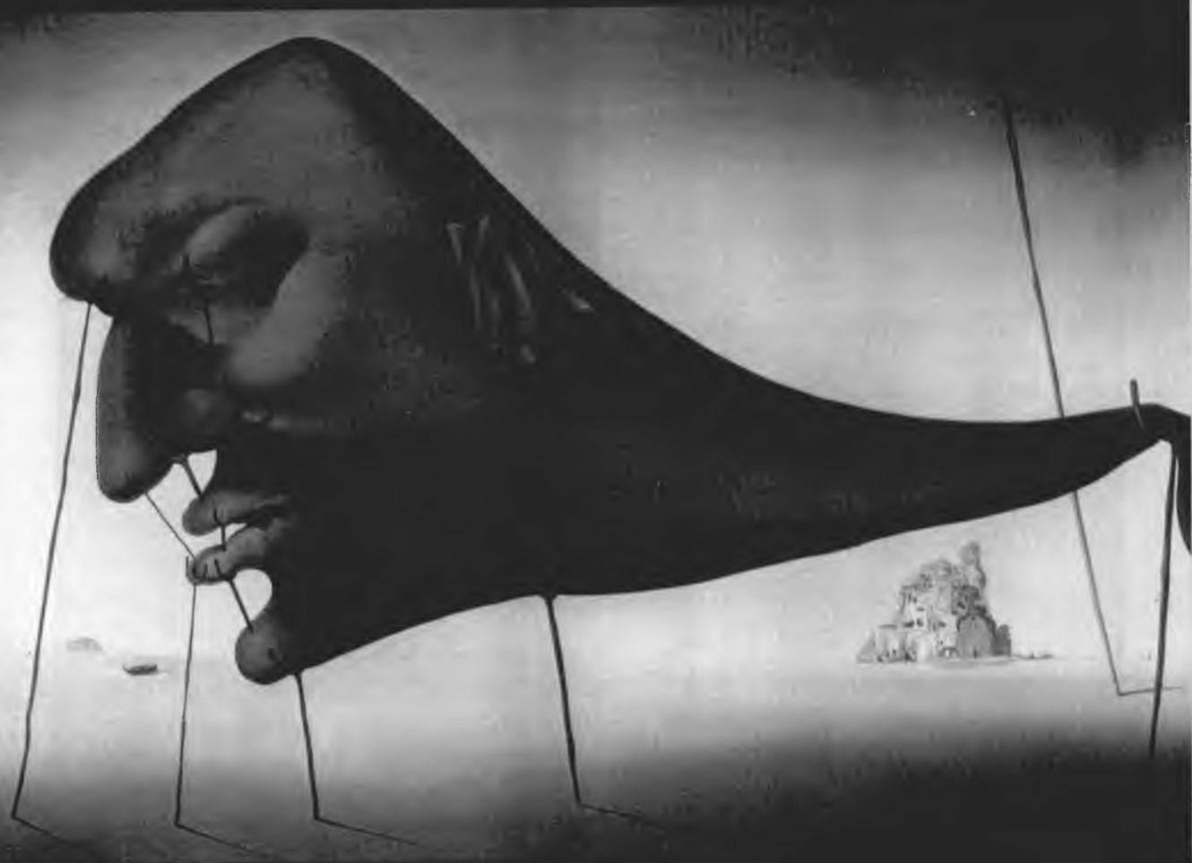
SALVADOR DALÍ: SPÁNEK