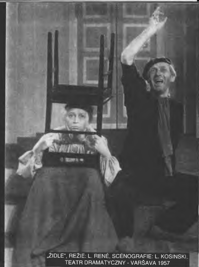
„ŽIDLE“, REŽIE: L. RENÉ, SCÉNOGRAFIE: L. KOSINSKI, TEATR DRAMATYCZNY - VARŠAVA 1957