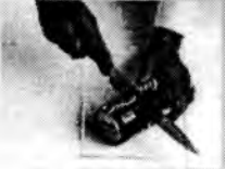
Řeže i plechové krabičky