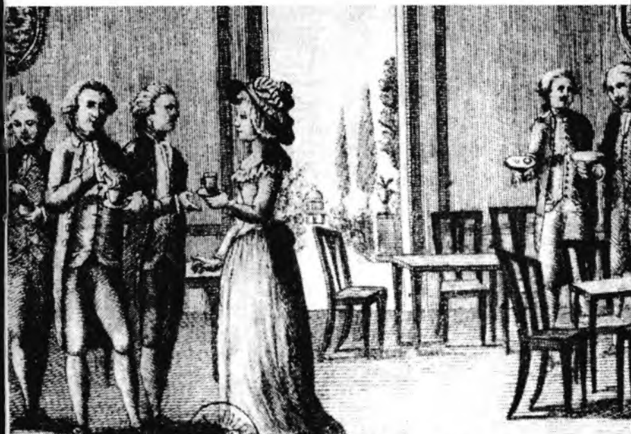
ilustrace ke Goldoniho hře „Na letním bytě“