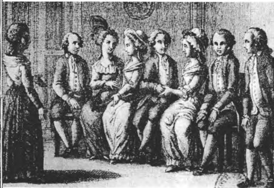
ilustrace ke Goldoniho hře „Kavalír a dáma“ (benátské vydání z roku 1788)