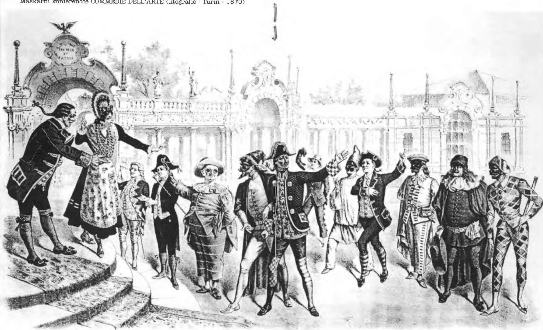
Maškarní konference COMEDIE DELL'ARTE (litografie - Turin - 1870)