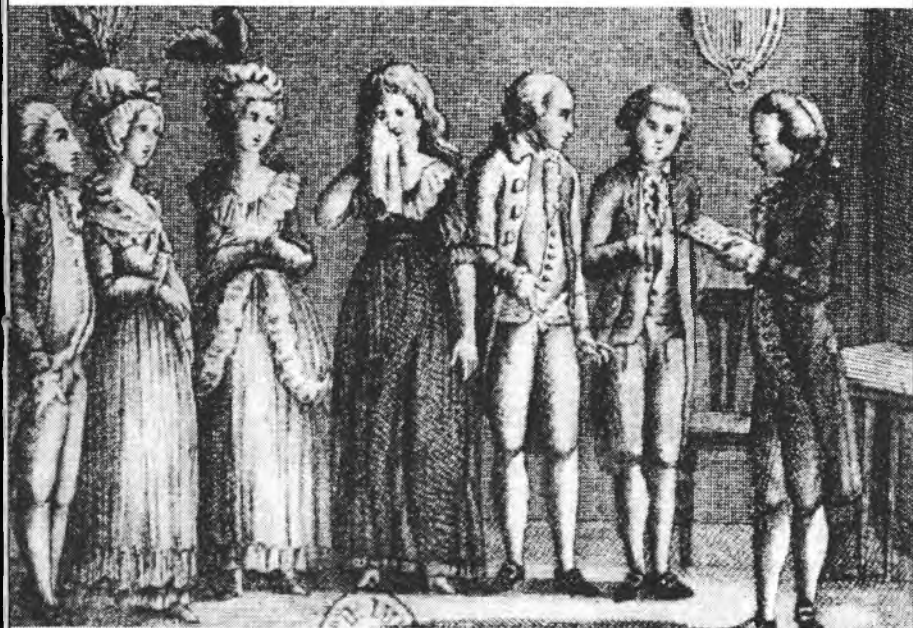
ilustrace ke Goldoniho hře „Zelindina trápení“ (benátské vydání z roku 1788)