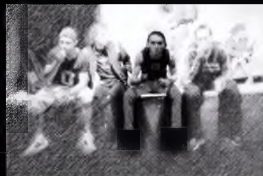
Jsou i jiné věci než je sex.

Jestliže jsi se nedokázal ztotožnit se žádnou z odpovědí, pak jsi: Swan, Alison, Lizzy, Krysička, Morčátko, Veverka, Králíček a nebo patříš do