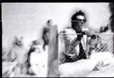
Jsi jeden velkej omyl.