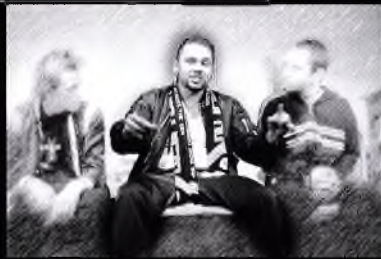
Jsi agresivní zmrď.