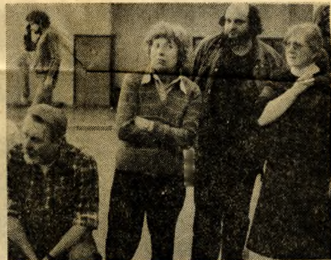
▲ Záběr ze zkoušky