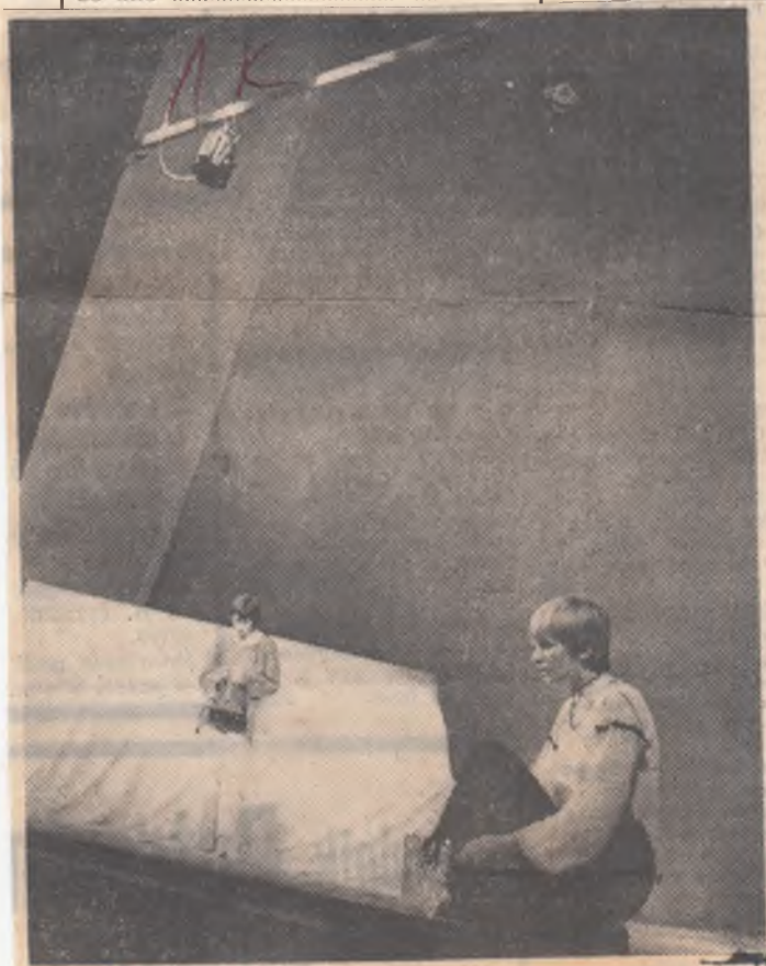
Divadlo Vítězného února v Hradci Králové uvádí nový muzikál „Aprílová holka“.